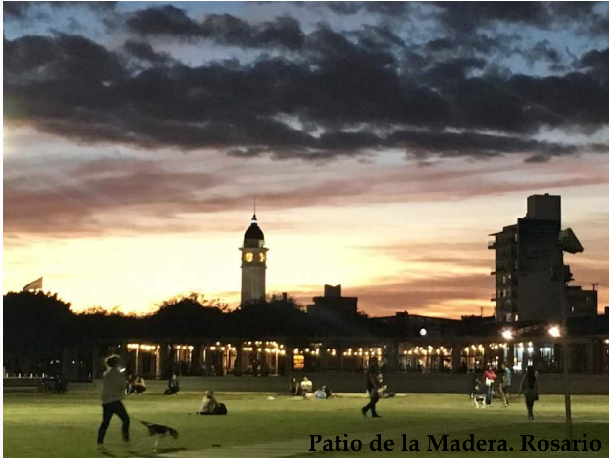
Patio de la Madera. Rosario